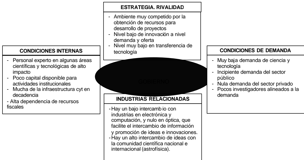
Figura 3. Diamante de Porter (Elaboración propia)

Pese a que Porter, con base en la descripción anterior, ubica al gobierno afuera de las cuatro fuerzas del diamante, en México prevalece la postura dominante del mismo en la vida de las instituciones públicas y privadas, predominando un ambiente altamente politizado y monopolizado en muchos sectores estratégicos para el país. Por lo tanto, en la ilustración 2, se muestra al gobierno como pieza fundamental para el análisis estratégico de un centro de investigación como el INAOE.